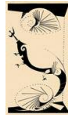
Ilustración de Batlle Planas para el libro Propiedades de la magia