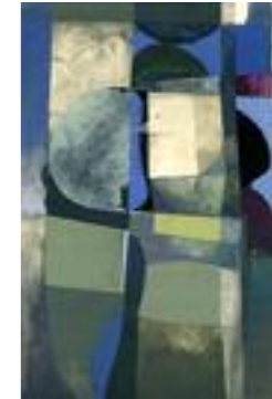
¡Ay! ¡Ay! ¡Ay!. otra vez la piedra en el ojo, 1960 Témpera sobre papel 25 x 20 cm