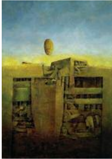
Noé Nojehowicz Sin título, 1970 Óleo sobre tela 55 x 40 cm Colección Fundación Alon

sus opuestos más desconcertantes fueron finalmente ajustados, unidos, porque la dádiva de la comprensión sólo es otorgada póstumamente.