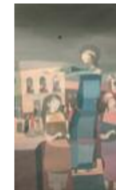
Figuras , 1959 Témpera sobre papel 53 x 32 cm Colección Fundación Alon