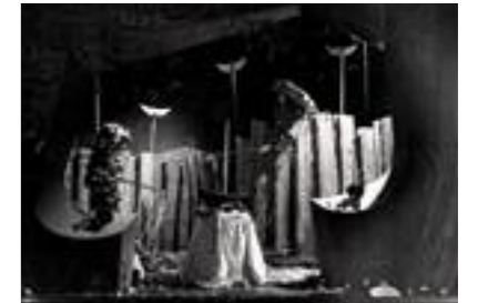
Vidrieras realizadas para Harrod's