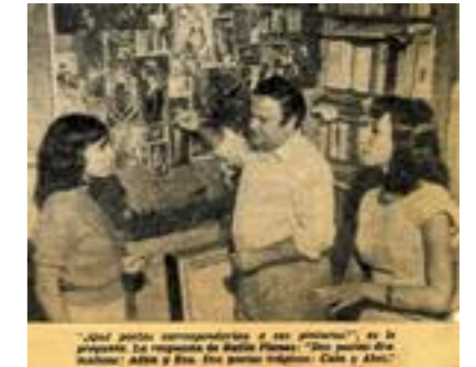
Batlle Planas junto a Alejandra Pizarnik