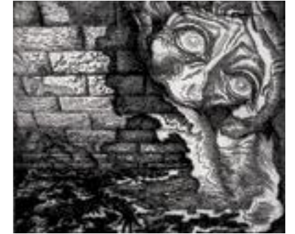
Lino Enea Spilimbergo Interlunio II , 1937 Aguafuerte 9,2 x 10,6 cm